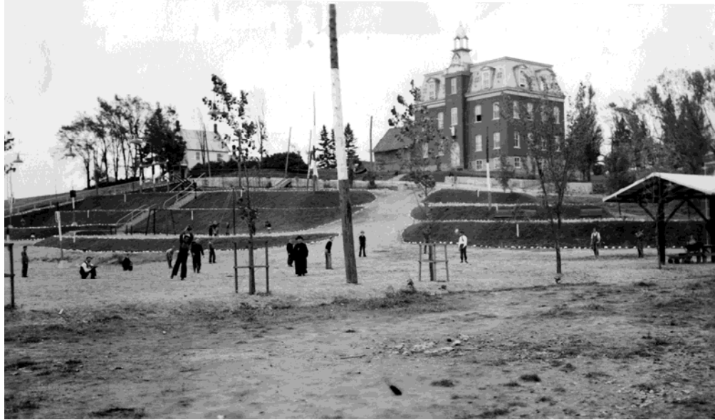
Académie du Sacré-Cœur, 1938.