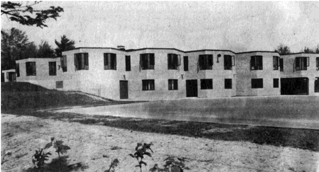
L'école du Boisjoli, 1978. ( La Tribune , 3 juin 1978, p. 9)

Autres dénominations pour l'établissement : s.o.