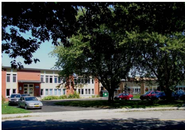
L'école Champlain, août 2010.

Autres dénominations pour l'établissement : s.o.