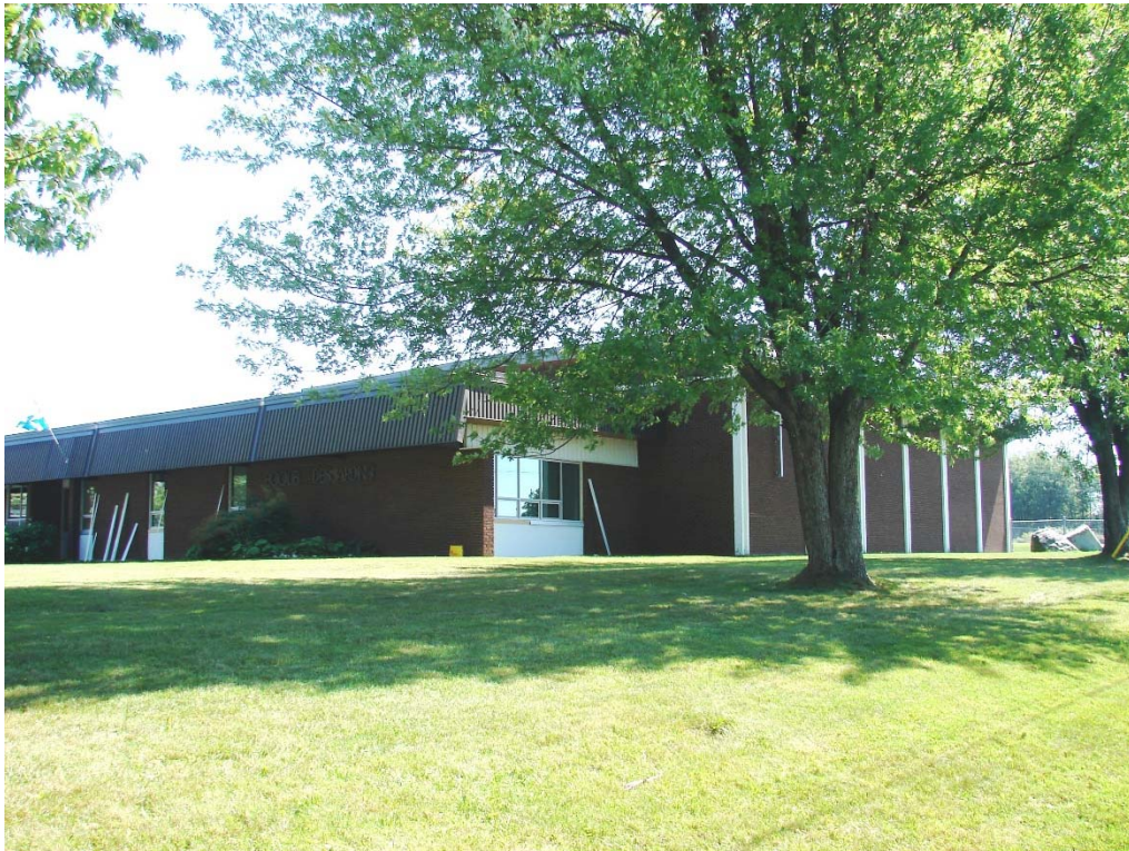
L'école Desjardins, août 2010.

Autres dénominations pour l'établissement : s.o.