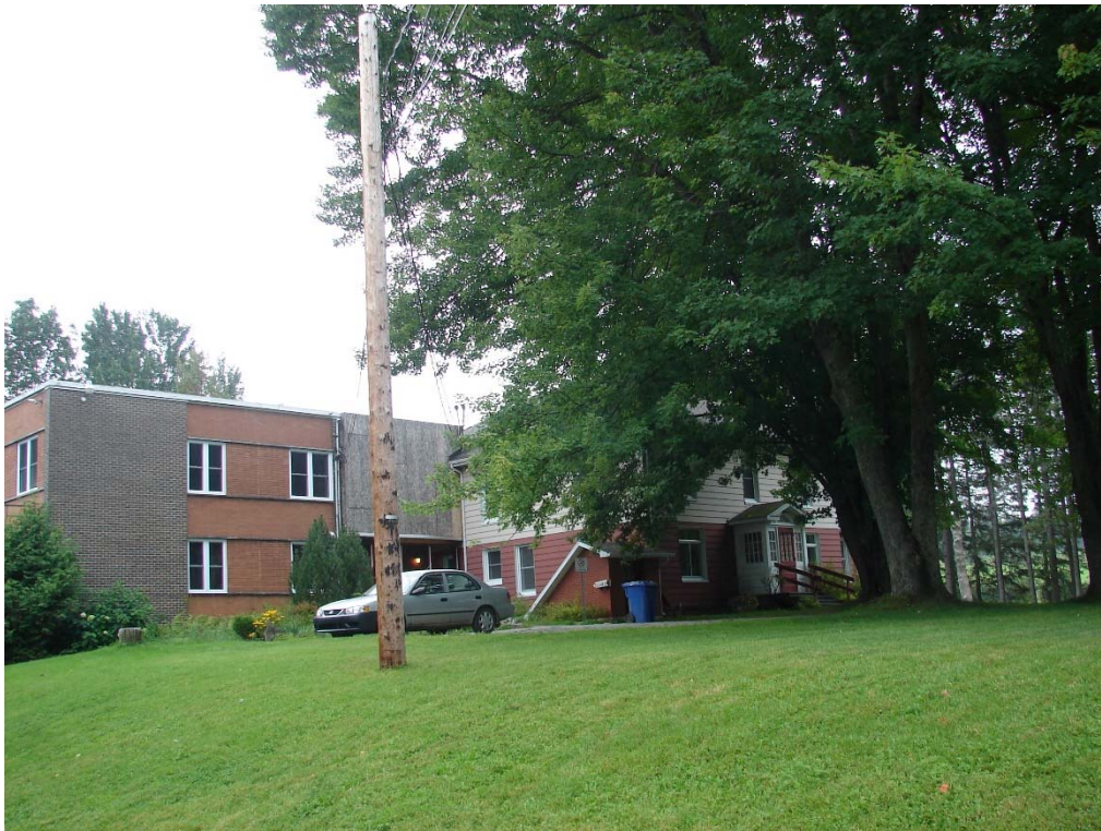
L'école des Enfants-de-la-Terre, août 2010.

Autres dénominations pour l'établissement : s.o.