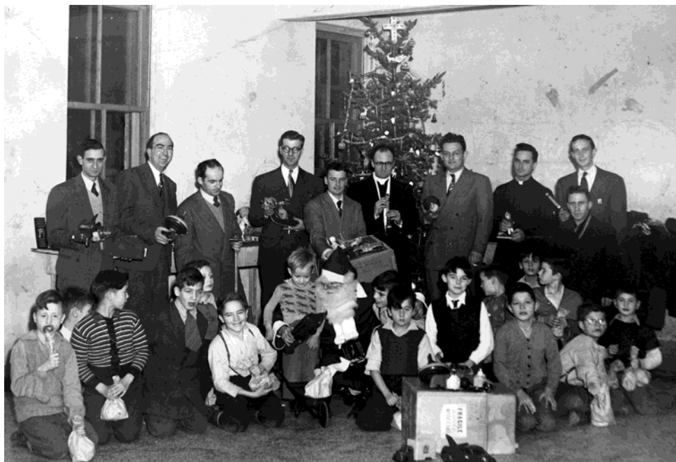
Fêtes de Noël pour les jeunes garçons du Centre Notre-Dame-de-la-Santé, 1949.

1958 : le Centre prend le nom de Notre-Dame-de-la-Joie 4