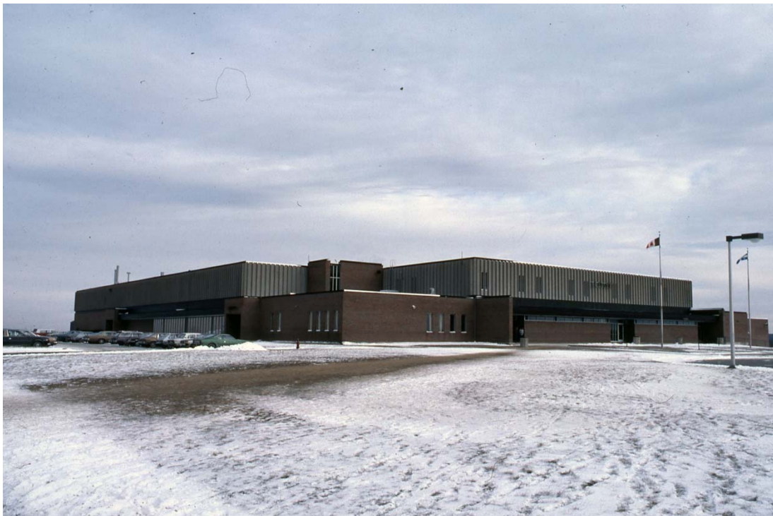
École secondaire du Phare, vers 1978. (Fonds CHLT-TV, Société d'histoire de Sherbrooke, IP310)

Autres dénominations pour l'établissement : Polyvalente Ouest 1-A (1971-1975) et École secondaire du Phare (1975-2011)