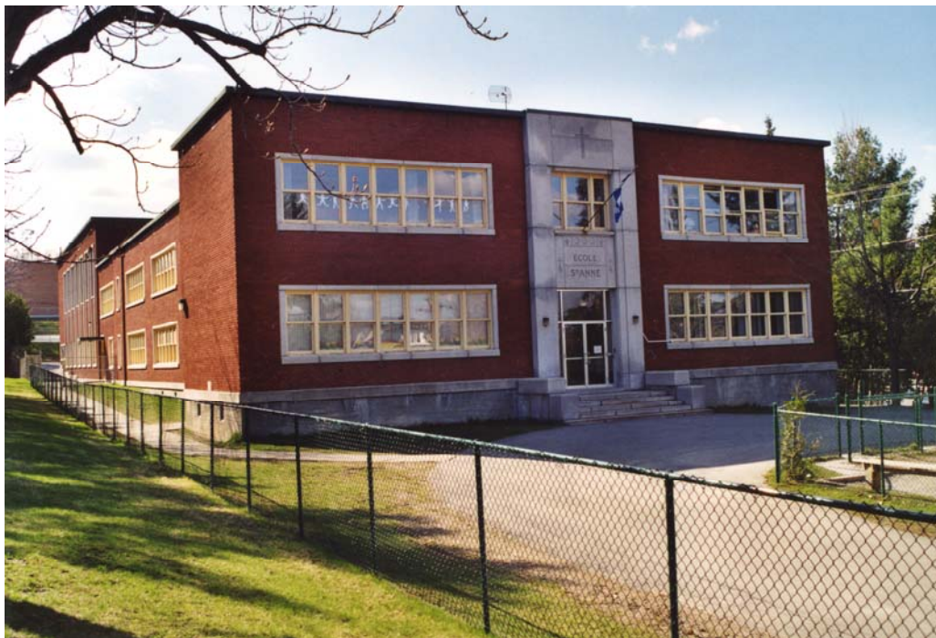
L'école Sainte-Anne, 2002.

Autres dénominations pour l'établissement : École du Nord