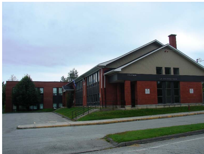
L'école de la Source-Vive, août 2010.

Autres dénominations pour l'établissement : Collège Saint-Stanislas (1959-[197?]) et École Notre-Dame-Auxiliatrice ([197?]-1988)