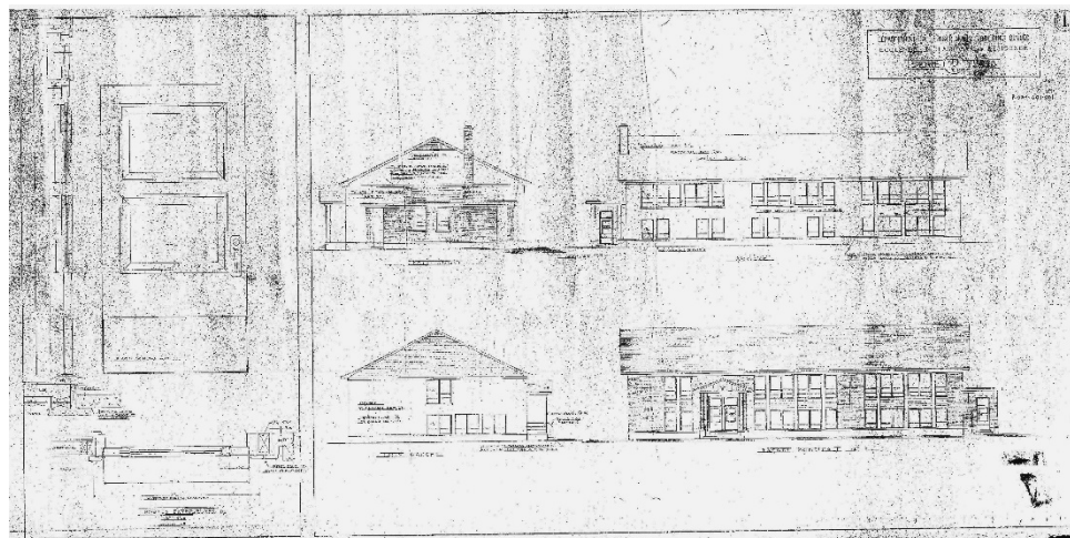
Plan de la série P-1958 du DIP, 1958. (P-037-001-001, FC.18 Plans des établissements de la CSRS)

13 janvier 1958 : les commissaires autorisent la construction d'une école de sept classes, sans logement, selon les plans et devis du DIP 3