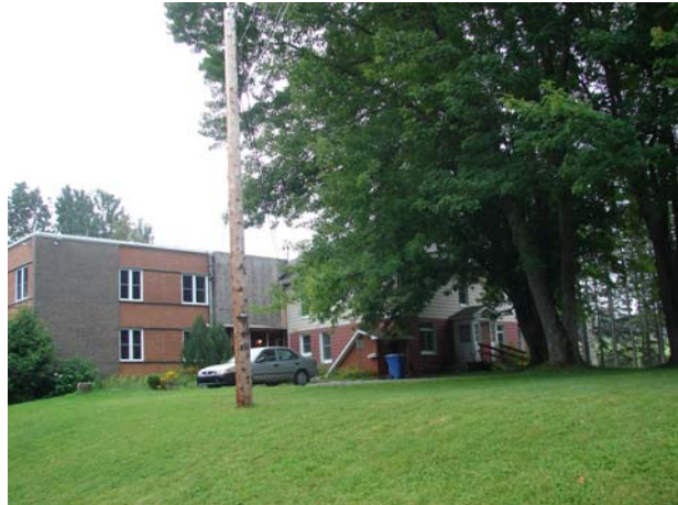
L'école des Enfants-de-la-Terre, août 2010.

Fait particulier, l'école est fondée en 1989 par un organisme sans but lucratif (OSBL), qui voit au maintien de l'établissement grâce aux contributions des parents et aux activités de financement. L'école des Enfants-de-la-Terre est tout d'abord établie sur le terrain de la Ferme La Généreuse, dans la Municipalité de Cookshire-Eaton.