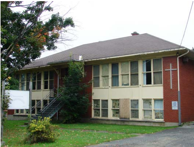
L'ancien collège de l'Assomption, connu par la suite sous le nom d'école Bougainville, août 2010.

En février 1956, les commissaires décrètent la construction d'une deuxième école pour le village ; il s'agit d'un projet d'école de cinq classes pour garçons. Pendant l'été qui suit, les commissaires acceptent l'offre des Frères de Sainte-Croix de fournir tout le personnel enseignant pour l'école. À l'ouverture de l'école en septembre, 85 garçons fréquentent l'établissement. Avec la création de cette école de garçons, qui prend le nom de collège de l'Assomption, l'école Notre-Dame-de-Tout-Pouvoir devient essentiellement une école pour filles (à l'exception de classes pour les plus jeunes garçons).