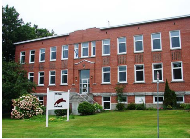
L'école de la Passerelle, août 2010.

Le dernier volet de l'histoire s'ouvre en 1982. Suite au départ des religieuses de l'école Notre-Dame-de-Tout-Pouvoir, les commissaires d'écoles sherbrookoises nomment un directeur laïque à la tête de l'école institutionnelle de Waterville (N.-D.-de-Tout-Pouvoir et Bougainville). En d'autres mots, il y a fusion administrative et pédagogique des deux écoles. En septembre 1993, les commissaires changent le nom de l'école institutionnelle de Waterville pour « école primaire de la Passerelle ». En juin 2004, on propose la formation d'un comité pour réfléchir à l'avenir de l'école de la Passerelle ; on note que le pavillon no 2 (ancienne école Bougainville) est fermé et qu'aucune décision n'est prise à propos de son utilisation future. Ces réflexions mènent finalement à la vente du bâtiment à la Municipalité de Waterville, en 2009. C'est donc dire que l'école de la Passerelle actuelle n'a plus qu'un bâtiment, celui situé dans l'ancienne école Notre-Dame-de-Tout-Pouvoir.